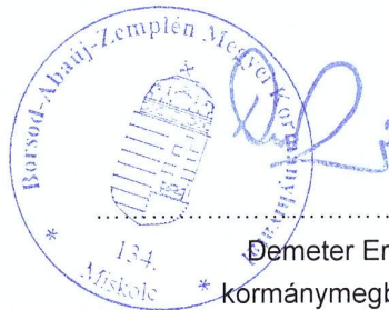
Demeter Ervin kormány megbízott